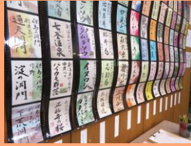
※写真は「楽しい書展」展示の様子です。